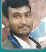
Neeraj Atomic Energy-EC