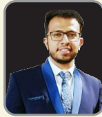
LAKSHYA SHARMA SSC-JE : CPWD