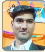
Multan Prajapat RIICO -AEn - CE