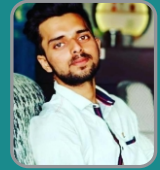
Danish PGCIL - CE